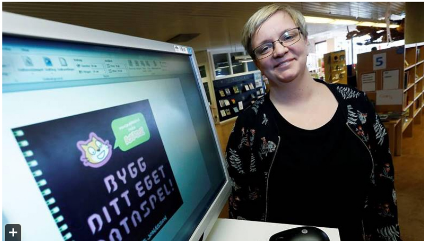
Unga skapar egna dataspel